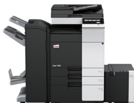
ineo + 258 s jednorůchodovým podavačem (DF-704), brožovacím finišerem (FS-534SD), velkokapacitním zásobníkem (LU-302) a velkokapacitní kazetou (PC-410)