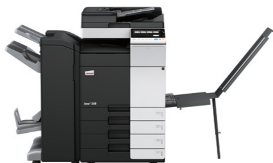
ineo + 258 s jednorůchodovým podavačem (DF-704), brožovacím finišerem (FS-534SD), držákem dlouhých papírů (BT-C1e) a dvěma přidavnými kazetami (PC-210)