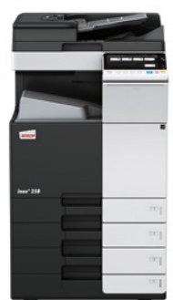
ineo + 258 s jednorůchodovým podavačem (DF-704), výstupní přihrádkou (OT-506) a dvěma přidavnými kazetami (PC-210)

Neomezujte se formátem a gramáží papíru. Můžete tisknout na obálky, recyklovaný papír, předtištěný papír, projektorové fólie a mnoho dalších médií o gramáži až 300 g/m 2 . Ve výborné kvalitě lze potisknout širokou škálu formátů papíru od A6 až po SRA3 (320 x 450 mm) nebo uživatelsky definované formáty a papíry dlouhé až 1,2 m. Díky širokému výběru dokončovacích funkcí jako je vytváření až 80stranových brožur, sešívání, děrování a dopisní sklad můžete vyrobit téměř jakýkoliv druh dokumentu.